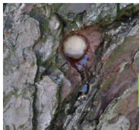
▲健康状態は、松ヤニの 出方で診断します。

これは『松くい虫』の被害を受けた松が、しおれて 枯れる症状です。一度感染してしまうと治療が難し いため、事前の予防が大切です。