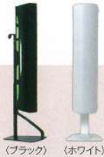
(ブラック) (ホワイト)

サイズ:幅235×奥行250×高さ860mm 電源コード:2.5m 重量:約7kg 有効面積:約50m 2 誘虫ランプ:1本(20W) 本体カラー:ブラック/ホワイト