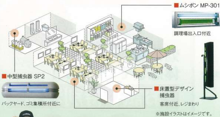
■ 中型捕虫器 SP2