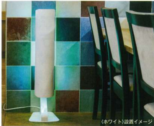
(ホワイト)設置イメージ